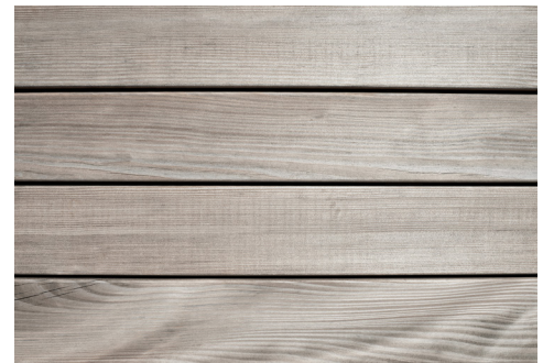
Après six mois d'exposition aux intempéries