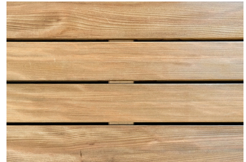
À la pose